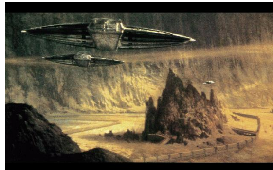
テアトル・クラシックス ACT.4 『デューン/砂の惑星』4Kリマスター版