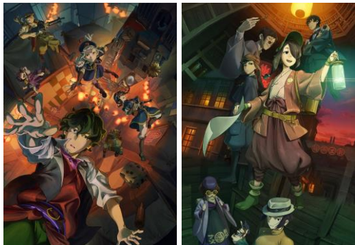
『クラユカバ』 『クラメルカガリ』